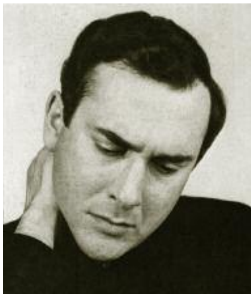
Harold Pinter (1930-2008)